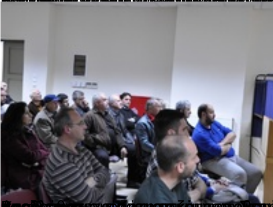
Επίσημο ανοιχτό σεμινάριο για την Αειμόρφωση και την Αειβιωσιμότητα