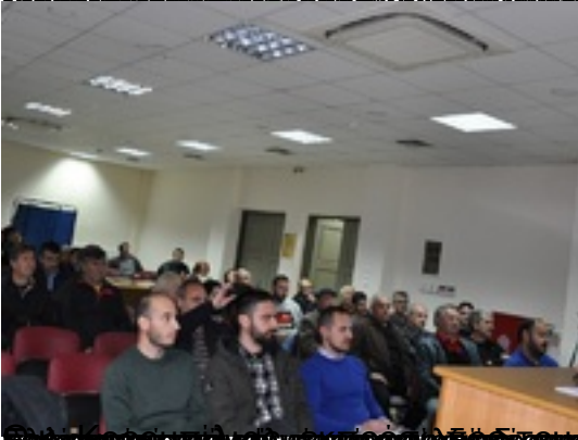
Επίσημο ανοιχτό σεμινάριο για την Αειμόρφωση και την Αειβιωσιμότητα